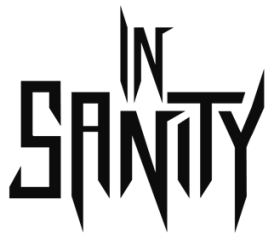
Das Logo ist eine Wortmarke .

In Sanity hat ein Logo und ein Branding . Beide sind als alleinstehende Werke zu betrachten und dürfen daher NICHT kombiniert oder zusammen abgebildet werden.