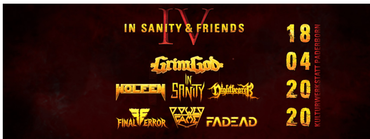
Facebook Titelbild der Veranstaltung In Sanity & Friends IV